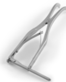
SPREIZZANGEN LAMINA SPREADERS