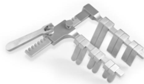
LAMINEKTOMIE-SPERRER LAMINECTOMY SPREADERS

Our manufacturing programme also comprises a variety of surgical spreaders – from the simple surgical spreader right up to surgical spreaders with exchangeable blades, with or without joint function. As regards needle holders, our speciality is the manufacturing of needle holders with carbide inserts and various jaw forms.