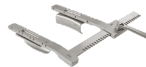
SPERRER AUS ALUMINIUM, TITAN UND ROSTFREIEM EDELSTAHL ALUMINIUM, TITANIUM AND STAINLESS STEEL RETRACTORS