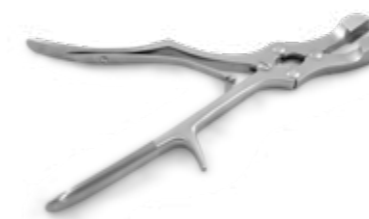
KNOCHENSPLITTERZANGEN, HOHLMEISSELZANGEN UND RIPPENSCHEREN BONE CUTTING FORCEPS, BONE RONGEUR FORCEPS, RIB SHEARS